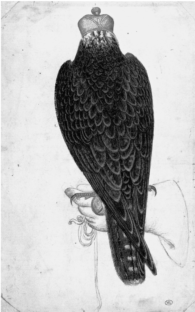
Pisanello, Falke von hinten mit blauem Hut, auf der Faust des Falkners , ca. 1435, Stift und Wasserfarbe auf weißem Papier