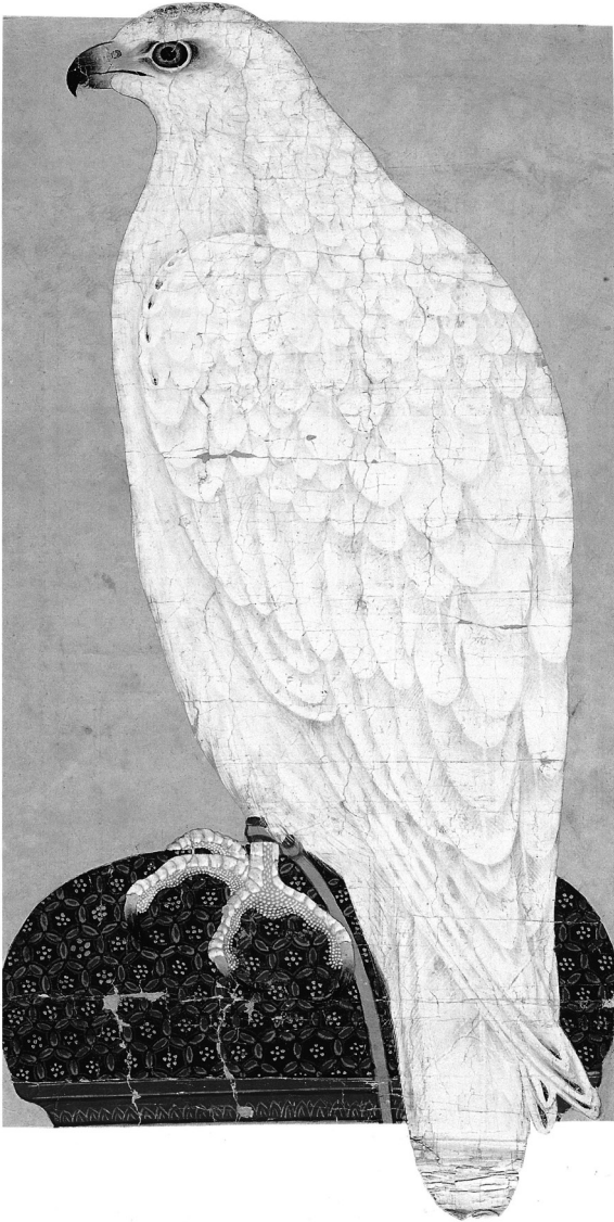
Gouache eines Gerfalken aus einem persischen Album mit Malereien und Kalligraphie, Mitte 15. Jahrhundert