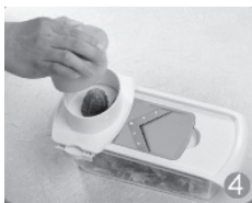
Benutzen Sie die Speiseführung, um das Gemüse nach unten zu drücken.