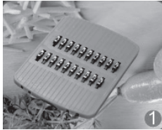
Rauer und feiner Julienne-Schneider