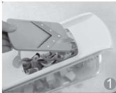
Gewünschtes Messer einlegen.