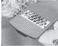
Reibe und Raspel