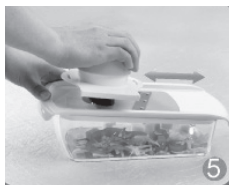
Schneiden Sie das Gemüse leicht und sicher, indem Sie die Speisefüh- rung nach unten drücken und die Gemüse-Halte- rung hin und herschieben.