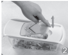
Zum Befestigen das Messer nach unten drücken; zum Entfernen das Messer an der Seite anheben.