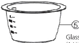
⑤ Glasschüssel (1 Liter)