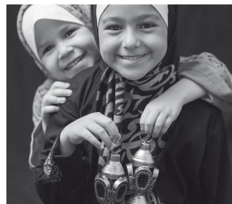
Während des Ramadan leuchten zur Dekoration bei vielen die Ramadanlaternen.

Im Fastenmonat Ramadan darf zwischen Sonnenauf- und -untergang nichts gegessen werden. Er endet mit dem Fastenbrechen, das türkische Muslime Zuckerfest nennen. Es dauert drei Tage und beginnt mit einem morgendlichen Gottesdienst in der Moschee. Danach gehen viele Muslime noch auf den Friedhof, um der Verstorbenen zu gedenken. Dann werden Verwandte besucht und es wird endlich wieder ordentlich gegessen – vor allem Süßes steht auf dem Speiseplan. Die Kinder bekommen außerdem Geschenke.