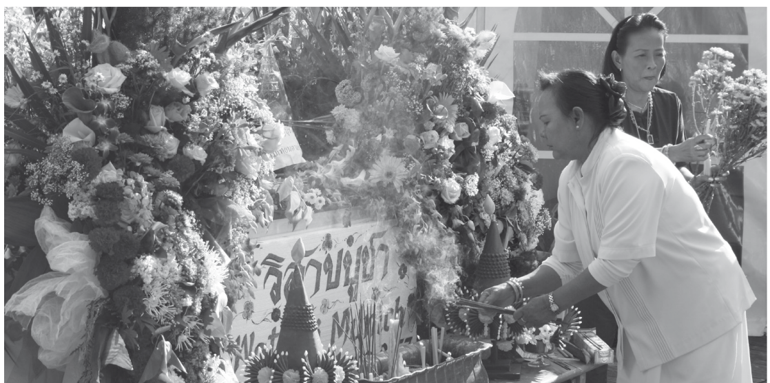
Eine Buddhistin zündet zum Vesakh-Fest in München Räucherstäbchen an.

Im Buddhismus stehen die Feste in Verbindung mit Buddhas Leben. Das wichtigste ist das Vesakh-Fest, an dem die Geburt, das Erwachen und der Eingang ins Nirwana Buddhas gefeiert werden. An diesem Tag ziehen viele Buddhisten weiße Gewänder an und schmücken die Tempel. In Nepal sind dann alle Geschäfte geschlossen.