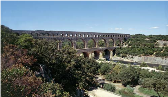
Aquädukt: Der Pont du Gard bei Nîmes (14 v. Chr.) zeigt heute noch eindrücklich, welchen Aufwand die Römer für ihre Wasserversorgung betrieben.

Wechselbädern erkannt hatte, entwickelte sich in der Nähe von Thermal- und Mineralquellen, wo das Badewasser natürlich temperiert zur Verfügung stand, ein regelrechter Kurbetrieb.