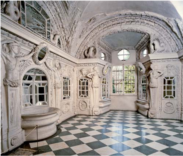
Barockbad im Neuen Schloss Baden-Baden, 1660

dokumentieren dies. Seuchen wie die Pest und Syphilis beendeten das freimütige, ausgelassene Treiben in den öffentlichen Badehäusern im 16. Jahrhundert und erreichten, was viele Verbote zuvor nicht vermocht hatten. Auch die Kur- und Heilbäder wurden wegen der Ansteckungsgefahr schließlich gemieden, davon profitierten die Trinkkuren. Allerdings gab es bereits vorher (an der Wende vom 15. zum 16. Jahrhundert) bei den Bevölkerungsschichten, die es sich leisten konnten – also insbesondere der Adel, aber auch das aufstrebende Bürgertum – die Tendenz, sich private Bäder einzurichten.