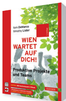
Tom DeMarco, Timothy Lister Wien wartet auf Dich! ISBN 978-3-446-43895-8