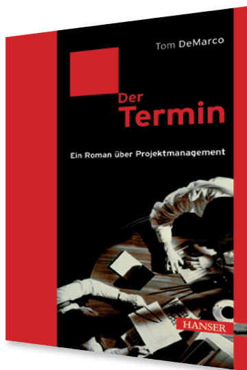
Tom DeMarco Der Termin ISBN 978-3-446-41439-6