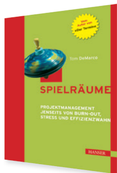
Tom DeMarco Spielräume ISBN 978-3-446-21665-5