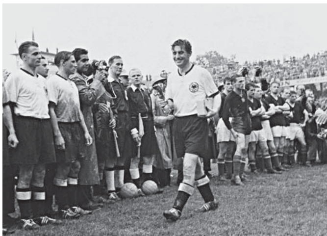
Spalier für den Weltmeister: Kapitän Fritz Walter empfängt in Wankdorf den Coupe Jules Rimet.