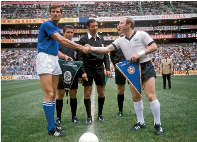
Historisches Händeschütteln: Uwe Seeler und Giacinto Facchetti schreiben Fußballgeschichte.