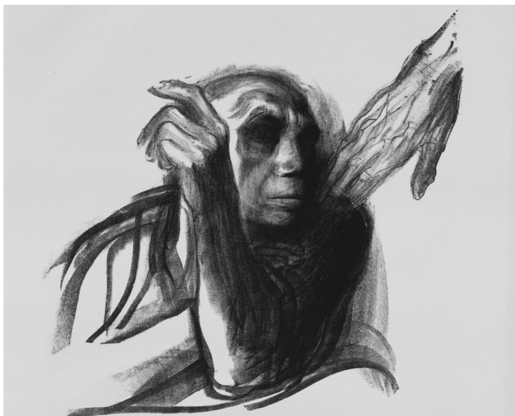
»Ruf des Todes«, Blatt 8 der Folge »Tod«, um 1937

Ein Münchner Verehrer ihrer Kunst bittet sie zu dieser Zeit um eine signierte Grafik. Die Antwort beschreibt ihren Seelenzustand: »Es geht nicht. Meine guten Zeichnungen sind in alle Winde verstreut. Ein kleiner Teil von dem Übrigbleibenden lagert in einem bombensicheren Keller und ist mir nicht zugänglich. Von diesem möchte ich mich nicht trennen. Was sonst noch bleibt, ist wirklich wertloseres Kleinzeug, das ich, eben weil es wertloser ist, nicht signieren möchte.« 11 Ein signiertes Bild verkauft die Kollwitz dann doch noch, für vierzig Reichsmark, eine Kreidelithografie, die in den 1930er-Jahren entstanden ist; bezeichnend der Titel: »Ruf des Todes«. 12