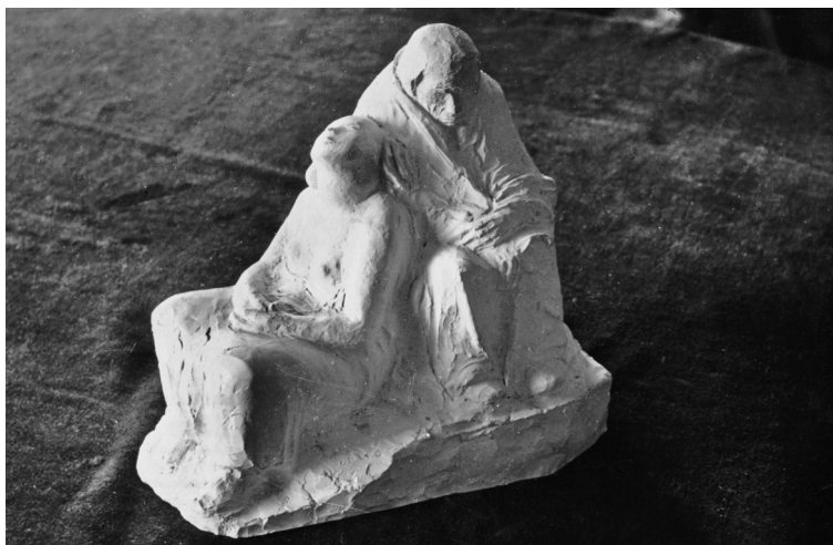
Zwei wartende Soldatenfrauen, 1943

am Kurfürstendamm zerstört. Zu diesem Zeitpunkt hat Kollwitz die eigene Arbeit aufgegeben. Die letzte Grafik liegt zwei Jahre zurück; die letzte Plastik »Zwei wartende Soldatenfrauen« wird gerade vollendet. Es gibt nichts mehr zu tun.