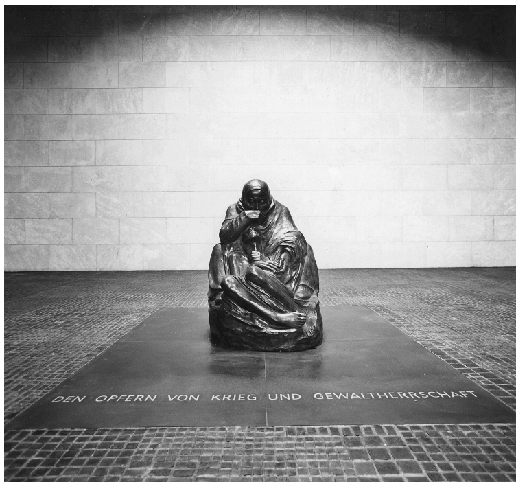
Die Pietà in der Neuen Wache Berlin

land, aber auch im Ausland verstreut; viele von ihnen sind noch nie systematisch ausgewertet worden bzw. bislang unbekannt geblieben. Bei den Recherchen sind wir zudem unverhofft auf verschollene Handzeichnungen gestoßen, die den Blick auf die Künstlerin wie auf den Menschen Käthe Kollwitz ungemein bereichern.