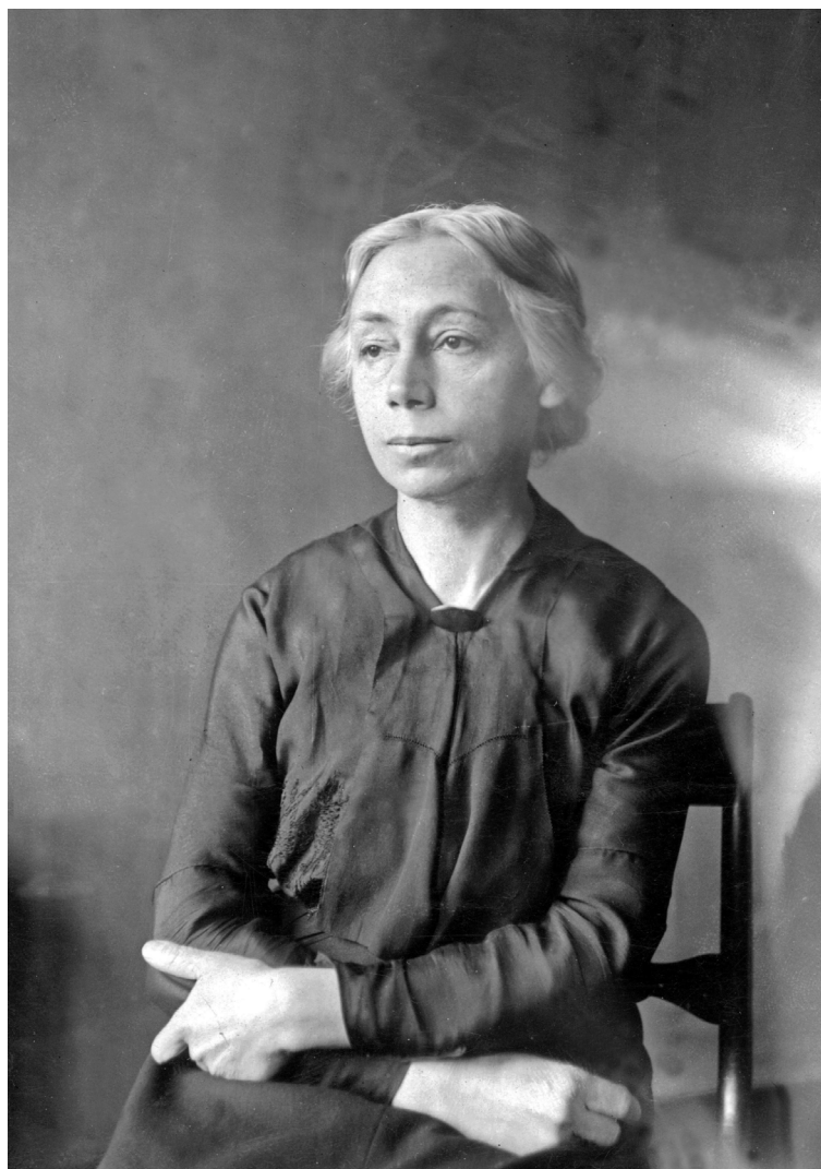
Käthe Kollwitz, 1929