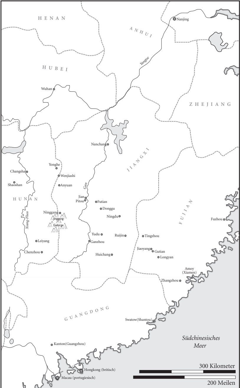
Das Gebiet, in dem Mao sich von 1927 bis 1934 aufhielt