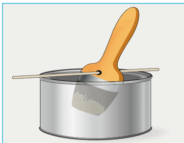
Löcher im Pinselstiel

Zum Wegfegen des Staubes nach dem Schleifen ist ein weicher, langhaariger Handfeger gut geeignet, zum Schrubben von glatten Oberflächen erweist eine Wurzelbürste hervorragende Dienste. Zum Putzen von Metallteilen benutzen wir Drahtbürsten. Zur Vermeidung von Flugrost sollten wir für Edelstahlteile allerdings nur Drahtbürsten aus Edelstahldraht verwenden und diese gleiche Bürste niemals für Normalstahl einsetzen.