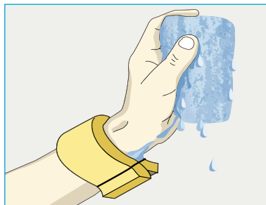
Schutz aus Schaumgummi

Schaumgummi um das Handgelenk gelegt, saugt das Wasser auf, wenn der Bootsboden abgewaschen wird. Das Wasser kann so nicht über den Unter- und Oberarm zum Körper laufen. Wir behalten trockene Kleidung und einen trockenen Körper.