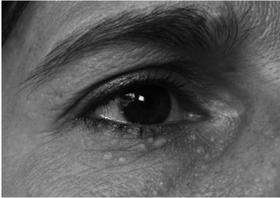
○ Abb. 6.1 Xanthelasmen

ten Ernährung. Weiter steigt das Risiko mit dem Alter. Zur Ätiologie der Folgeerkrankungen Arteriosklerose und Schlaganfall ▶Kap. 5, koronare Herzkrankheit ▶Kap. 3 und Herzinfarkt, ▶Kap. 4.