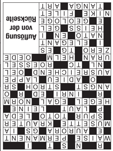
Die Auflösung dieses Rätsels finden Sie auf der Rückseite.