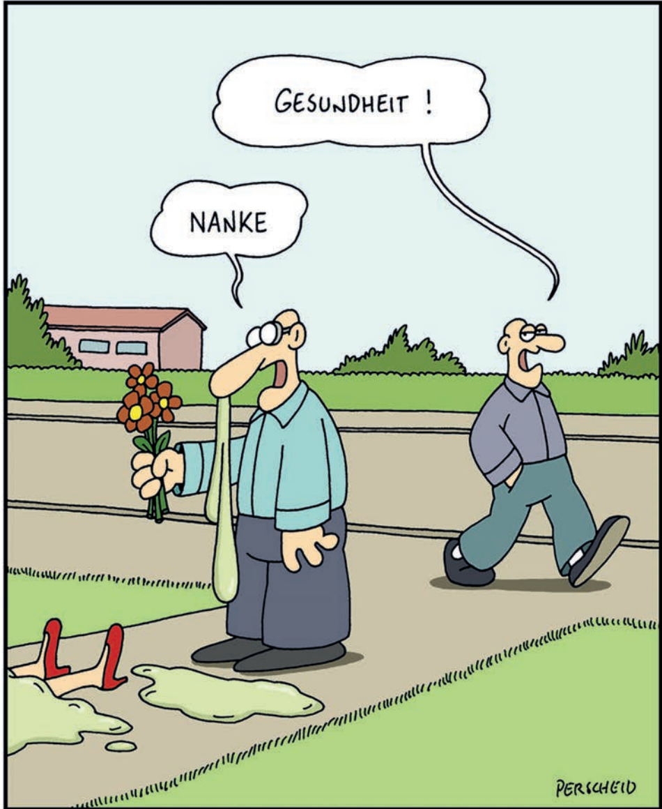
BLUMENALLERGIE KONTRA FIRST DATE