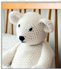
Eisbär Lilly 44