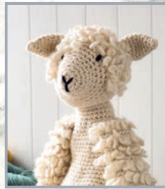
Alpaka Gabriel 88