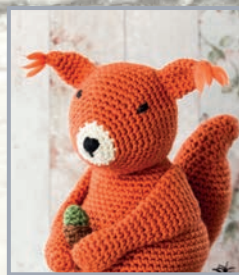
Eichhörnchen Kielder 116