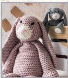
Hase Mabel mit Baby 38