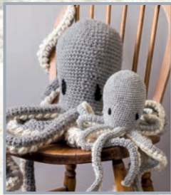
Tintenfisch Oliver mit Baby 76