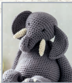
Elefant Ruby 50