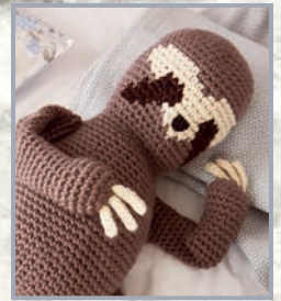
Faultier Doris 94