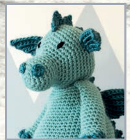
Drache Titi 122