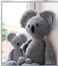
Koala Matilda mit Baby 110