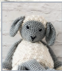
Lamm Lionel 104