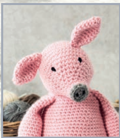
Schwein Clarence 98