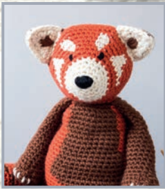
Kleiner Panda Florence 70