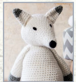
Eisfuchs Trevor 64