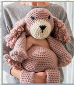
Hund Stitch 82