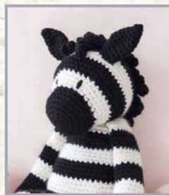
Zebra Walter 58