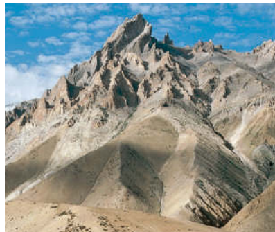
Hochgebirgswüste in Ladakh

Das größte Umweltproblem ist der starke Bevölkerungsdruck und damit die Übernutzung der Ressourcen, etwa des Grundwassers, sowie die rasant wachsende Verstädterung.