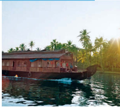
Auf Hausboottour in den Backwaters

10 Kreuzfahrt in den Backwaters Mit nur zwei komfortablen Kabinen schippert die Sauber Nigam »ECO-Friendly« durch die stille Wasserlandschaft der Backwaters > S. 132. Auf dem offenen Deck wird feinste