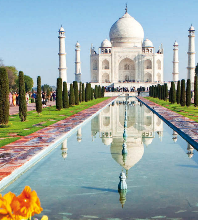
Das Taj Mahal spiegelt sich im Wasserbecken der Gartenanlage