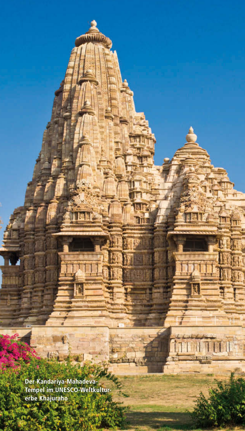
Der Kandariya-Mahadeva- Tempel im UNESCO-Weltkultur- erbe Khajuraho